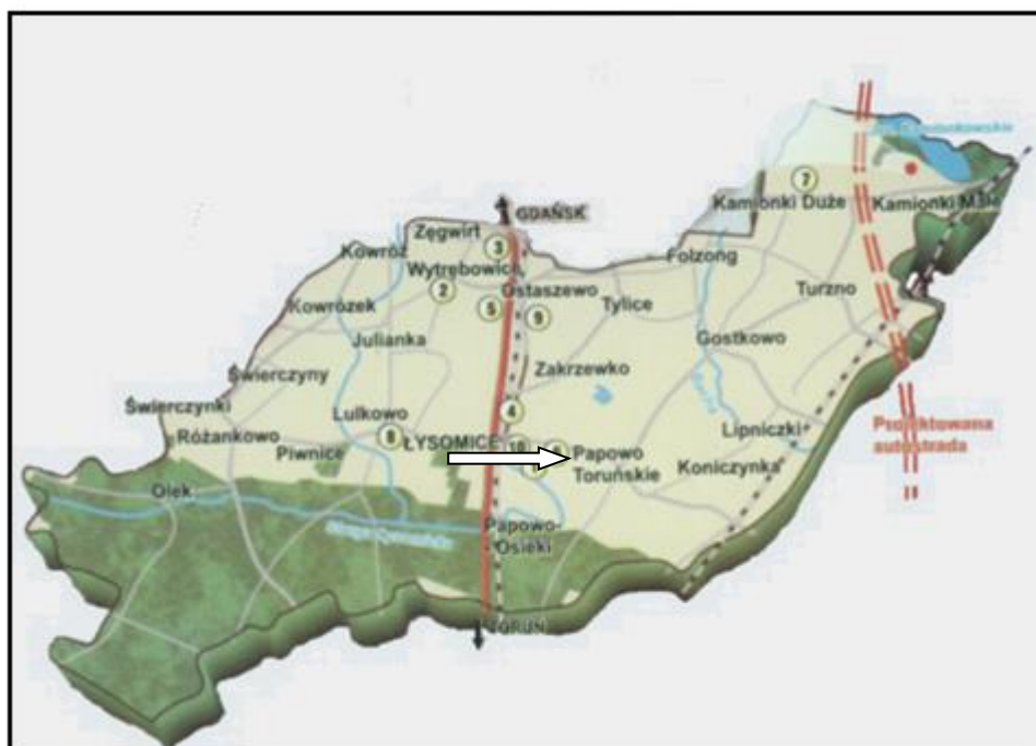
Mapa 2. Położenie miejscowości Papowo Toruńskie na mapie Gminy Łysomice.

Papowo Toruńskie posiada kościół parafialny zbudowany około 1300 r., wpisany do rejestru zabytków, do którego należą następujące miejscowości: Koniczynka, Łysomice, Osieki, Papowo Toruńskie i Zakrzewko. Przy kościele mieści się plebania murowana z początku XX wieku oraz czynny cmentarz parafialny z początku XIX w. Co roku w czerwcu, odcinkiem drogi wojewódzkiej nr 552 przez centrum wsi, przebiega procesja Bożego Ciała, w której uczestniczą wierni z miejscowości Papowa, Łysomic, Zakrzewka, Koniczynki i Osiek. Ponadto znajduje się tu także zespół budynków stacji kolejowej czynny od 1871 r., trzy strażnice drogowe z końca XIX w. a także w bardzo złym stanie dwór z końca XIX w. oraz liczne około stuletnie zamieszkałe domy. W miejscowości tej znajduje się również Ochotnicza Straż Pożarna posiadająca długoletnią historię swej działalności. W czerwcu 2008 roku, obchodzono 100-lecie powstania tej jednostki. Obok remizy strażackiej mieści czynna świetlica wiejska, z której korzystają chętnie wszyscy mieszkańcy tej miejscowości oraz Koło Gospodyń Wiejskich z Papowa. Na terenie tej miejscowości funkcjonuje Przedszkole Publiczne Jelonek. Sołectwo to posiada także 4 place zabaw (jeden w Koniczynce), siłownię zewnętrzne i boisko trawiaste do piłki nożnej.